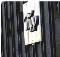
Hammar Nordic Plugg tycker att det logiska är att svenska staten ska kräva tillbaka pengarna från Topp-försäljningen.