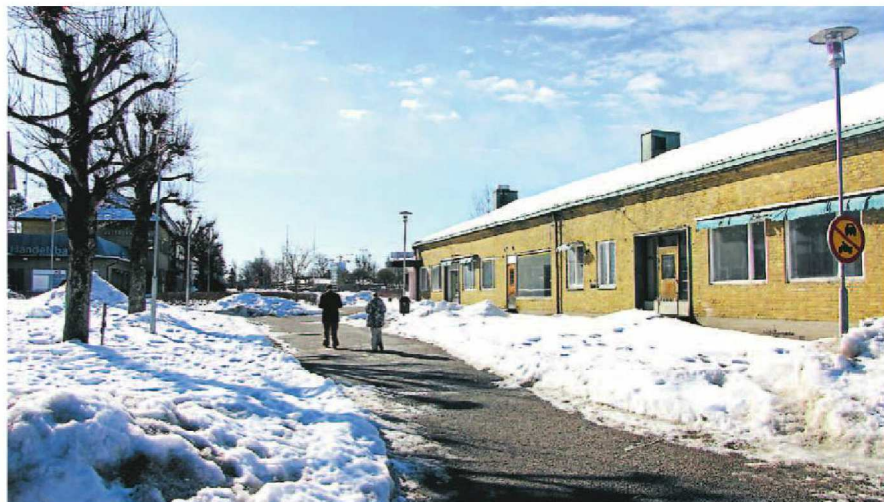
SKA BORT. Det gamla posthuset i Lilla Edet har snart stått tomt i ett år i väntan på rivning. Men nu ska det verkligen bli av. Den 1 maj ska det vara borta. Då börjar man bygga den första fasen av det nya Centrumhuset.

Som det ser ut nu är det fullt till 35 procent i lokalerna. Men när Netto blir